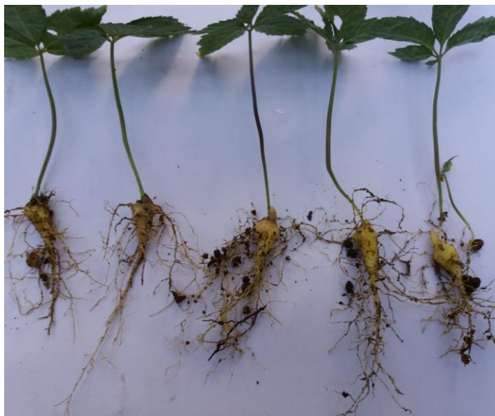
CÂY GIỐNG SÂM NGỌC LINH 01 NĂM TUỔI