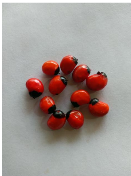
HẠT GIỐNG SÂM NGỌC LINH