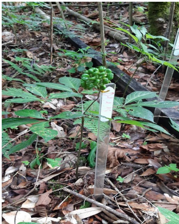
CÂY GIỐNG SÂM NGỌC LINH MẸ (TRỘI)