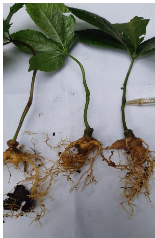
CÂY GIỐNG SÂM NGỌC LINH 02 NĂM TUỔI